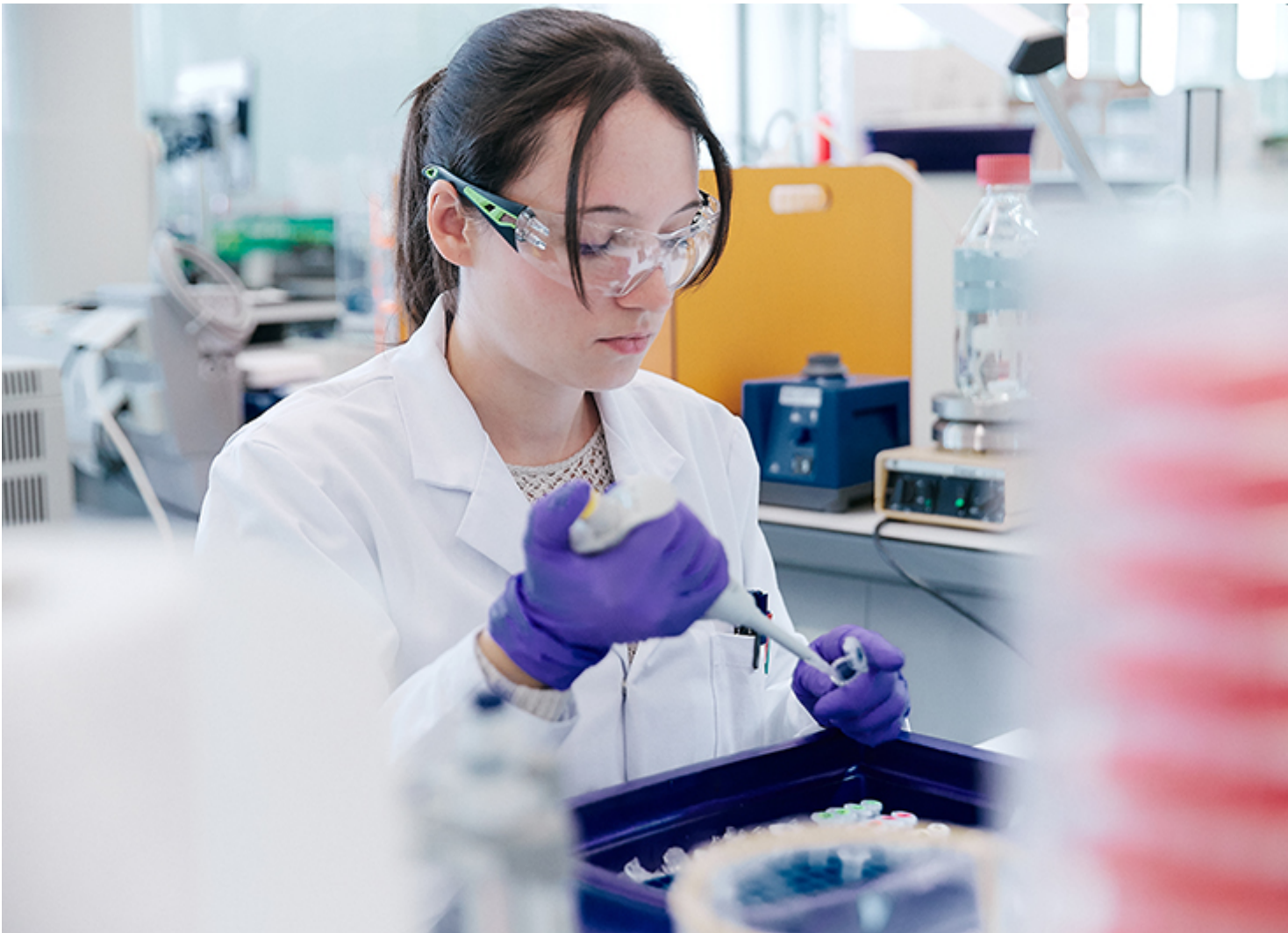
Recherche sur des échantillons de tissus

Par ailleurs, les activités des gènes ne sont pas identiques d'un prélèvement à l'autre et sont donc souvent difficilement comparables. Tout comme l'expérimentation médicale sur les plaies, pratiquée à ses débuts essentiellement sur des soldats blessés, les études actuelles se basent sur un grand nombre d'échantillons sains prélevés essentiellement lors d'opérations chirurgicales effectuées sur un grand nombre de patients différents, notamment des patients relativement jeunes, actifs, ayant des organes qui fonctionnent bien et une bonne circulation sanguine. Autrement dit, sur des patients qui ont précisément le profil opposé aux patients les plus à risque, à savoir les patients âgés, alités, en surpoids ou diabétiques.